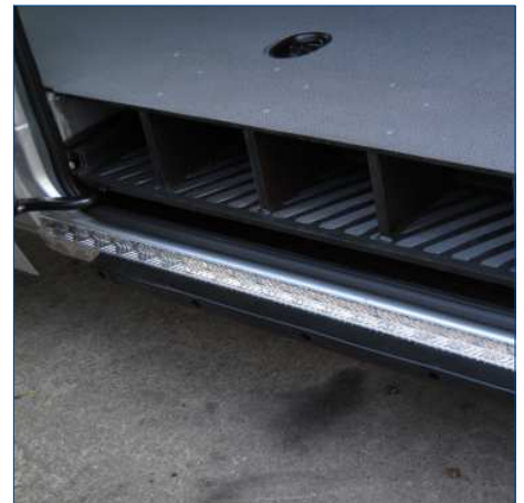
Fussbodenerweiterung im Trittbereich der Schiebetüren mit durchgängigem Boden