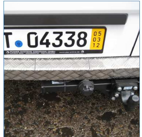
Stosstangenverkleidung Aluriffelblech Versetzung Anhängerkupplung mit Gutachten