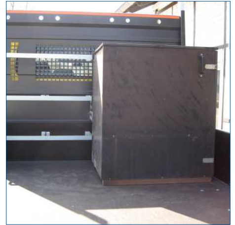
Abschließbare Kiste für offene Ladefläche und Spezialhalter