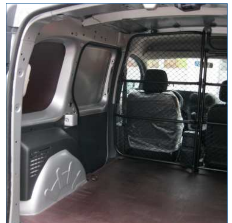
Seitenverkleidung und Fussboden für DB CITAN