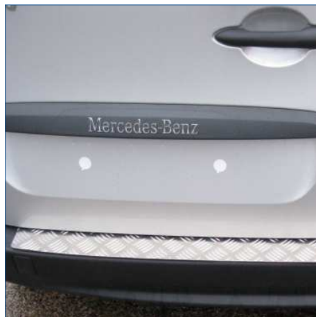
Stosstangenverkleidung für DB CITAN