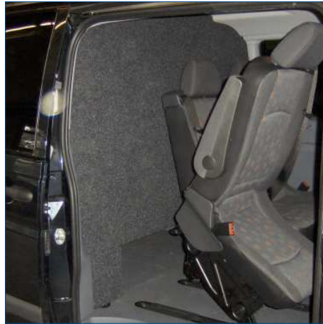
Trennwand mit Durchreiche mit Verkleidung von Innenraum gesehen