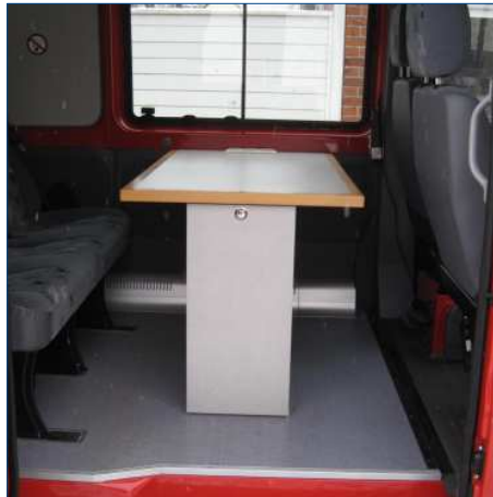
Fussboden mit Antirutschbelag und Tischlösung mit Auszugsschublade