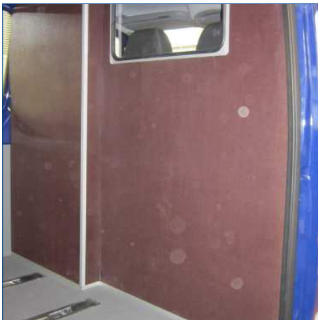
Trennwand mit Versatz für Fahrersitz und feststehendem Fenster