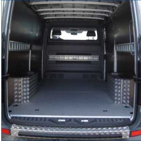
Verkleidung Radkasten Riffelblech mit Fach Stosstangenverkleidung mit Rammschutzleiste

Böden, Seitenverkleidungen, Trennwände (mit Klappen, Durchreichen, etc.), Fahrzeugdämmung, Zurr- und Klemmleisten, verschiedenste Befestigungssysteme, Fahrzeugschutz durch Verkleidungen oder Rammschutze, Trittstufen, Durchlässe, etc.