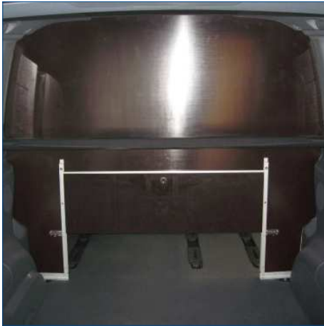
Trennwand mit Durchreiche von Rückseite gesehen

Böden, Seitenverkleidungen, Trennwände (mit Klappen, Durchreichen, etc.), Fahrzeugdämmung, Zurr- und Klemmleisten, verschiedenste Befestigungssysteme, Fahrzeugschutz durch Verkleidungen oder Rammschutze, Trittstufen, Durchlässe, etc.