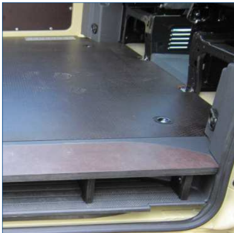
Fussbodenerweiterung im Trittbereich der Seitenschiebetüren