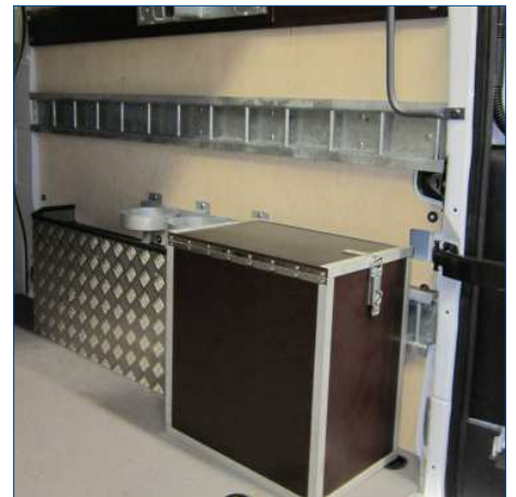
Kiste für Gasflaschen, Spezial-Halter und Radkastenverkleidung mit Dämmung