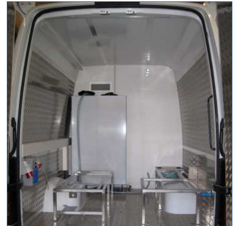
Seitenverkleidung mit Aluriffelblech und Dachverkleidung mit Alucubond, komplette Dämmung