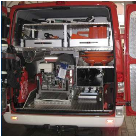
Komplettes Feuerwehrfahrzeug nach Sonderwunsch mit Verkleidungen und Funktionen