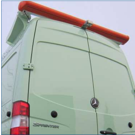
Elektrische Markise an Fahrzeugheck nachgerüstete Rückfahrkamera

Hier einige Beispiele für unsere vielfältigen Sonderlösungen: Markisen (auch elektrisch), Standheizungen, Klimaanlage, Dachlüfter