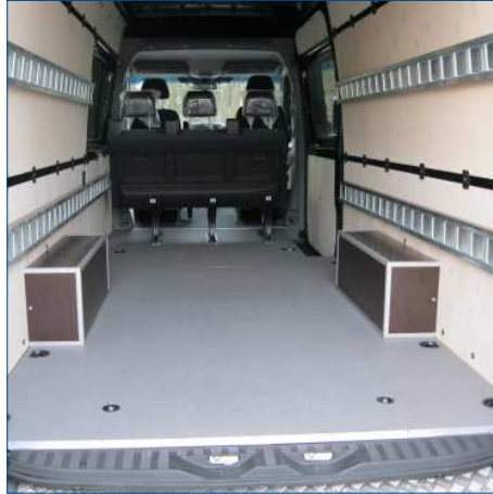
Verkleidung Radkasten mit Siebdruckkästen Seitenbefestigungsschienen