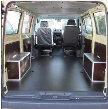
Verkleidung Radkasten mit Siebdruck, diverse Seitenverkleidungen