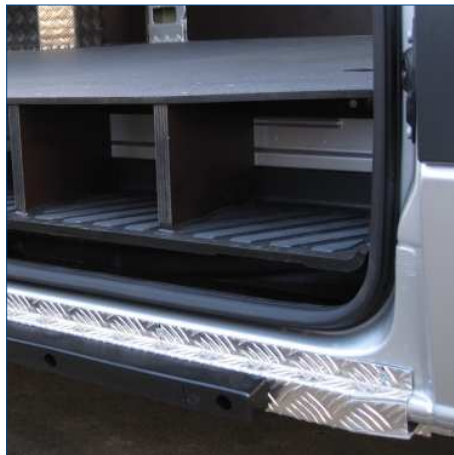
Fussbodenerweiterung im Trittbereich der Schiebetüren mit durchgängigem Boden