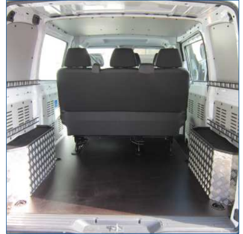
Verkleidung Radkasten Riffelblech mit Fach Seitenbefestigungsschienen