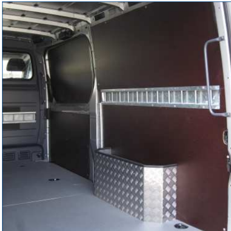
Verkleidung Radkasten Riffelblech mit Fach diverse Seitenverkleidungen mit Dämmung