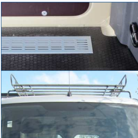
Oben: Lüftungsführung im Fahrzeugboden Unten: Spezial-Dachgepäckträger Sprinter