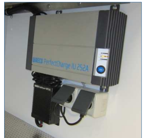
12 Volt Zusatzladegerät für erste und zweite Fahrzeugbatterie, für Fremdeinspeisung