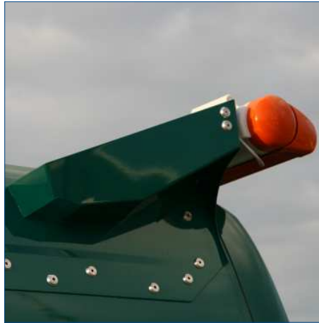
Elektrische Markise an Fahrzeugheck mit Halter in Fahrzeugfarbe lackiert