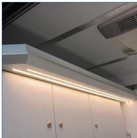
LED-12 Volt Beleuchtung mit Schienen, in Einfräsungen. Für Innen und Aussen.