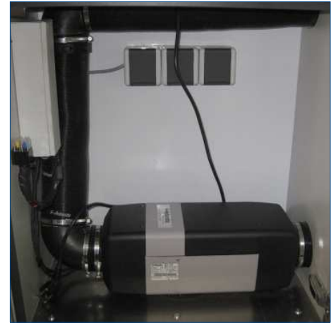
Nachrüstung Standheizung mit verschiedenen Steuerungen und Luftführungen